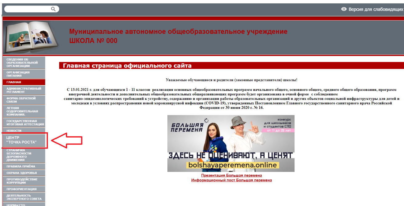
Рисунок 2. Пример размещения ссылки на раздел на сайте общеобразовательной организации

На официальном сайте общеобразовательной организации, в которой создается центр образования естественно-научной и технологической направленностей «Точка роста» (далее – центр «Точка роста», центр) в рамках федерального проекта «Современная школа» национального проекта «Образование», не позднее даты начала функционирования центра (не позднее 1 сентября года создания центра) создается раздел «Центр «Точка роста». Ссылка на раздел размещается в главном меню сайта общеобразовательной организации и должна быть видима при просмотре каждой страницы. Ссылка не может являться вложенной в другие меню. Пример размещения ссылки на раздел «Центр «Точка роста» в меню официального сайта общеобразовательной организации в информационно-телекоммуникационной сети «Интернет» приведен на рисунке 2.